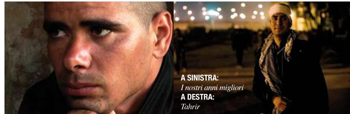
A SINISTRA: I nostri anni migliori A DESTRA: Tahrir

al 16 ottobre, si è occupato di primavera araba, con il già menzionato documentario di Stefano Savona, così come il Festival del Cinema Africano che si è svolto a Verona dall'11 al 20 novembre. Quest'ultima kermesse ha dedicato una sezione alle rivoluzioni democratiche dei paesi arabi, con il documentario collettivo 18 Days , di cui si è già detto sopra, e con I nostri anni migliori di Matteo Calori e Stefano Collizzolli, che racconta la vita sotto la dittatura di Ben Ali e poi i giorni della rivoluzione, attraverso le parole di cinque immigrati tunisini arrivati in Italia proprio nei giorni successivi alla rivolta, che ci parlano dagli accampamenti di emergenza in cui sono stati sistemati, a Taranto, a Potenza e a Catania, in attesa di poter raggiungere la Francia, la Germania o il Belgio. Le storie di speranza, ma anche di grande sofferenza, che essi ci raccontano ci mostrano un mondo pieno di contraddizioni e ci fanno capire quanto ancora siano acerbi i frutti di questa primavera.