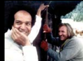
IN QUESTA PAGINA: Benhadj e Depardieu