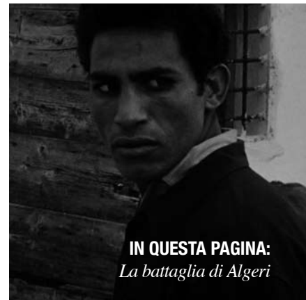
IN QUESTA PAGINA: La battaglia di Algeri