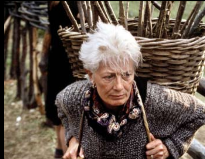
IN QUESTA PAGINA: Vanessa Redgrave in Mirka

Il primo risale al 1989 ed è Louss – Roses des Sables . Il film è ambientato in un villaggio circondato dal deserto, retto da dure leggi arcaiche, in cui vivono Moussa, un ragazzo privo di braccia e con una gamba sola, e sua sorella Zineb. Moussa riuscirà a superare le difficoltà del suo handicap e a essere autosufficiente, imparando a usare il piede come fosse una mano. Zineb si confronta col bisogno e le incertezze di una futura vita matrimoniale, scontrandosi con le norme e i divieti della sua cultura e della sua società e manifestando una propria indipendenza nel prendere ogni giorno l'unica corriera utile per recarsi a lavoro. I due cercano, ognuno in modo diverso, di costruire un proprio spazio vitale pur nella difficoltà estrema in cui vivono, e proprio Moussa appare forte di speranza, come quando, proprio nel luogo desertico in cui vive, inaffia ogni giorno una rosa sognando Mariam,