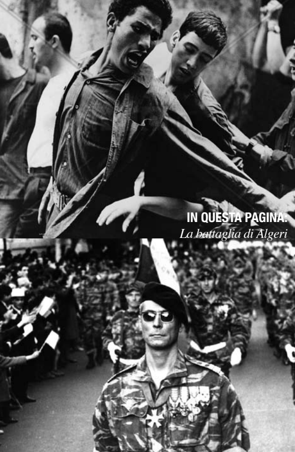
IN QUESTA PAGINA. La battaglia di Algeri