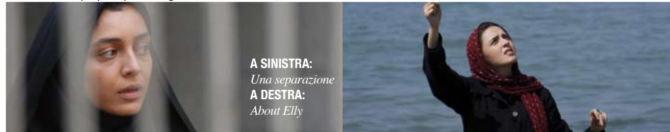
A SINISTRA: Una separazione A DESTRA: About Elly

Farhadi non ha né il realismo poetico di Abbas Kiarostami né la radicalità politica di Panahi. Il regista persegue piuttosto un cinema "glocale" che, pur essendo radicato saldamente nello spazio del suo paese, riesce a essere a suo modo anche universale grazie a un approccio antropologico ed esistenziale, più che geografico e sociologico. Ma è proprio questa la grande forza del suo cinema.